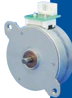
PM Type Motors